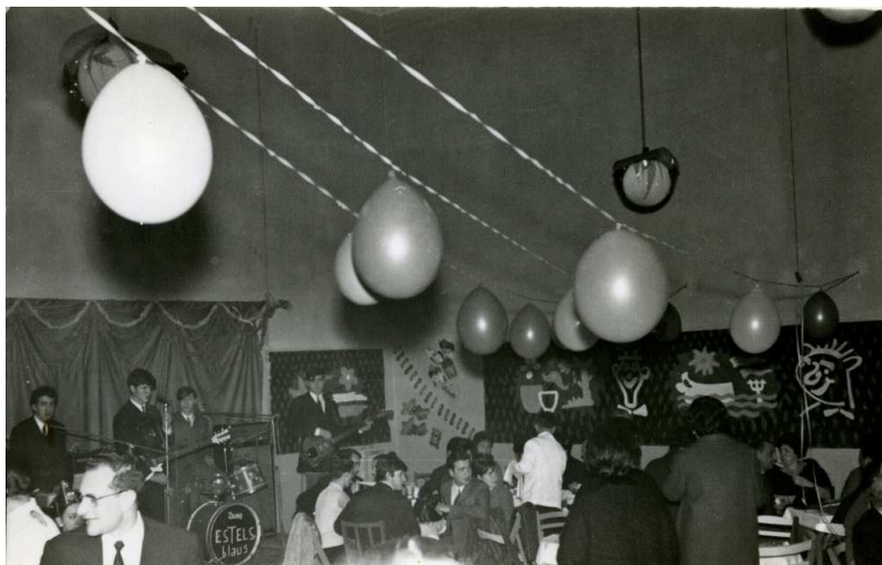
Ball amb el conjunt Estels Blaus, 1968