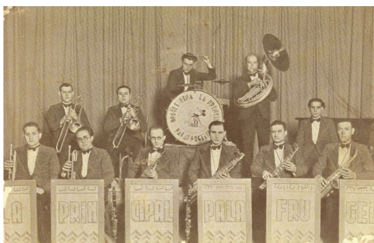
La Principal de Palafrugell adaptada al jazz i amb la imatge de Mickey Mouse (ca. 1936). AMP, col·lecció Joaquim Borràs.