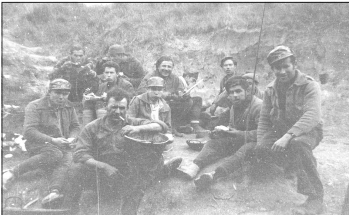
Al front d'Aragó. 1937