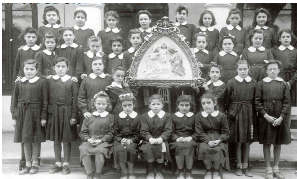
Alumnes dels cursos 1948-1950

La presència de les Germanes Carmelites de la Caritat Vedruna a Palafrugell està ben documentada a l'Arxiu Municipal. El motiu és la cessió per part de les Germanes de bibliografia, un resum cronològic de les seves activitats, que abasta de 1859 a 2003, i un recull de fotografies.