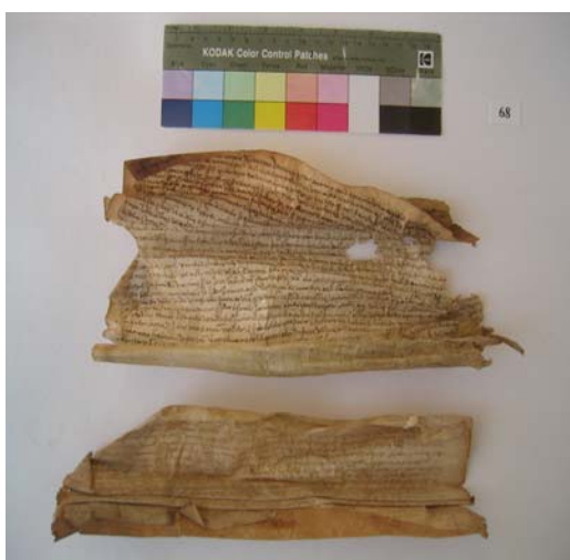
Dos dels pergamins abans de la restauració