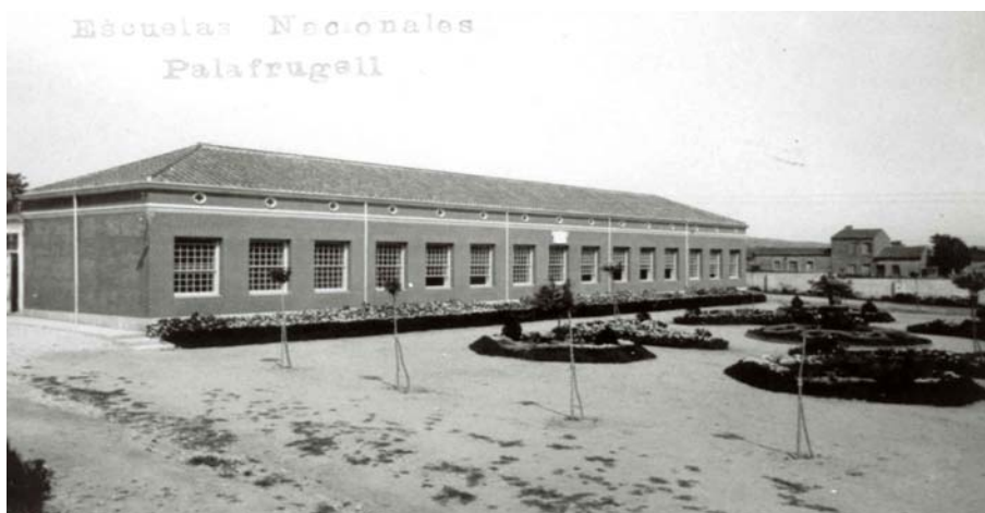
El col·legi Torres Jonama acabat de construir, l'any 1925.