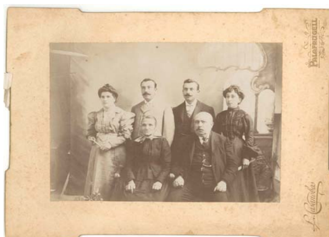
Retrat de finals del segle XIX.