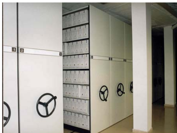
Dipòsit de documents a Can Rosés