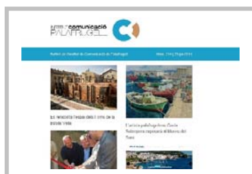
Nou disseny del butlletí setmanal