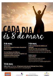
Cartell del 8 de març de 2017