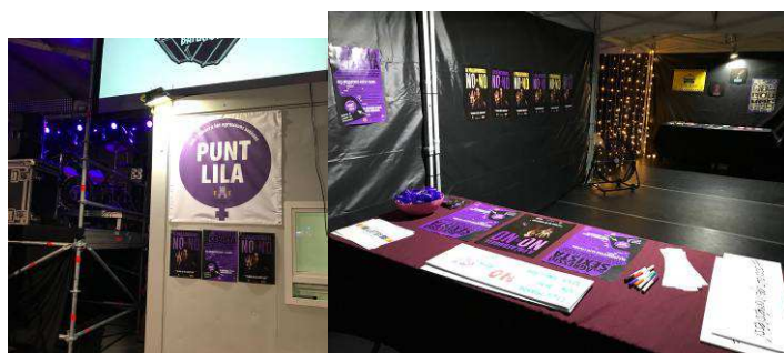
Punt Lila Festa Major

Conjuntament amb Can Genis, en l'espai Chill Out es va fer un photocall amb el lema #noesno i cada persona que penjava una foto a xarxes amb el lema se li donava una polsera. A més a més, hi havia tríptics explicatius de violència masclista. Es va desenvolupar de forma coordinada amb diversos agents de l'ajuntament, un protocol intern per agressions sexistes i sexuals, i a més a més, el Punt Lila hi va estar present els tres dies de festes majors fins al tancament dels concerts.