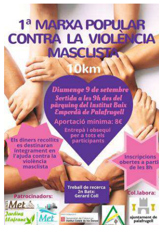
Cartell Marxa Popular

Es va donar suport a la proposta d'un treball de recerca d'un jove Palafrugellenc, el qual va voler organitzar una cursa popular contra la violència masclista. On els diners van anar destinats a actes relacionats amb la violència masclista. La proposta guanyadora va ser realitzar un taller extra a alumnes de 2n d'ESO per treballar les violències masclistes.