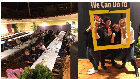
I Sopar de dones