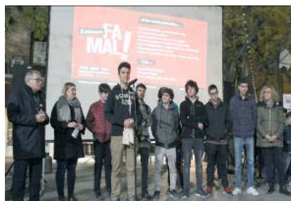
Presentació videoclip del grup Festucs en motiu del Dia Internacional contra la violència de gènere