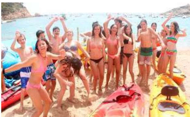
Estiu Jove – Campus audiovisual