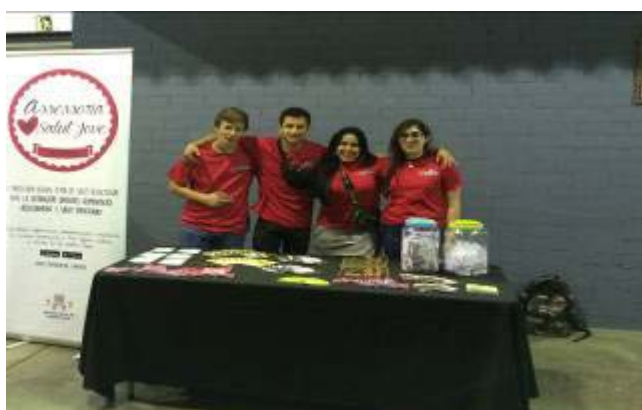
Agents Joves de Salut a la III Jornada de cultura urbana