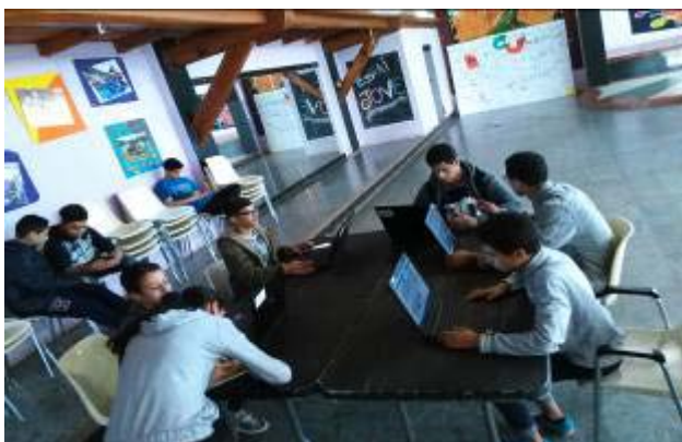
Espai Jove – activitat diària