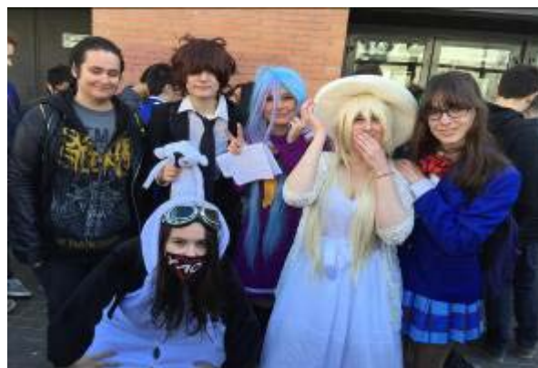
Activitats Can Genís – sortida a la Japan Weekend