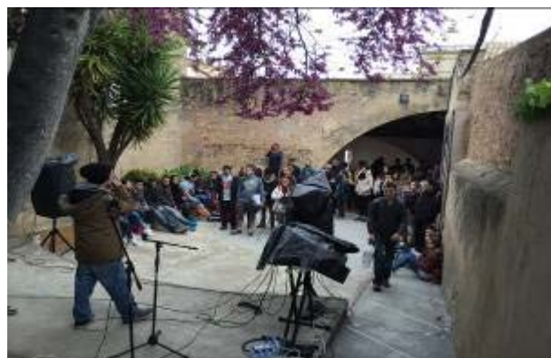
Activitats Can Genís – concert al pati