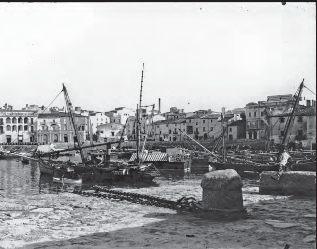
uerra, l'estació de tren.