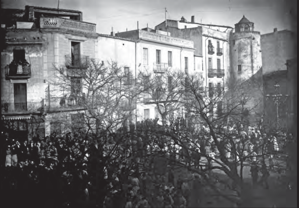
La Plaça Nova de Palafrugell plena de gent, durant algun tipus de celebració o acte públic. Al fons, la torre de Can Moragues que formava part del recinte emmurallat de la ciutat. Al costat, una font de ferro amb forma de canelobre de cinc fanals i cinc metres d'altura, procedent de la ciutat de París. La fotografia està realitzada des d'un balcó de l'Hotel Oriente. (1900-1907)