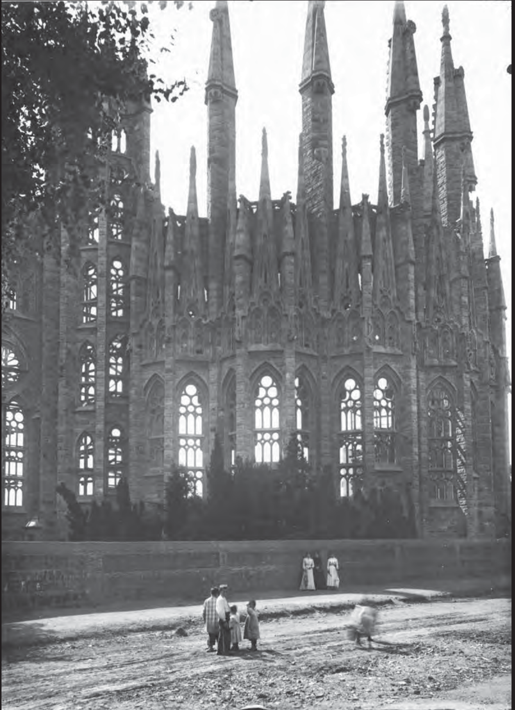
Absis del temple expiatori de la Sagrada Família, de l'arquitecte català Antoni Gaudí, en construcció. (1910-1915)