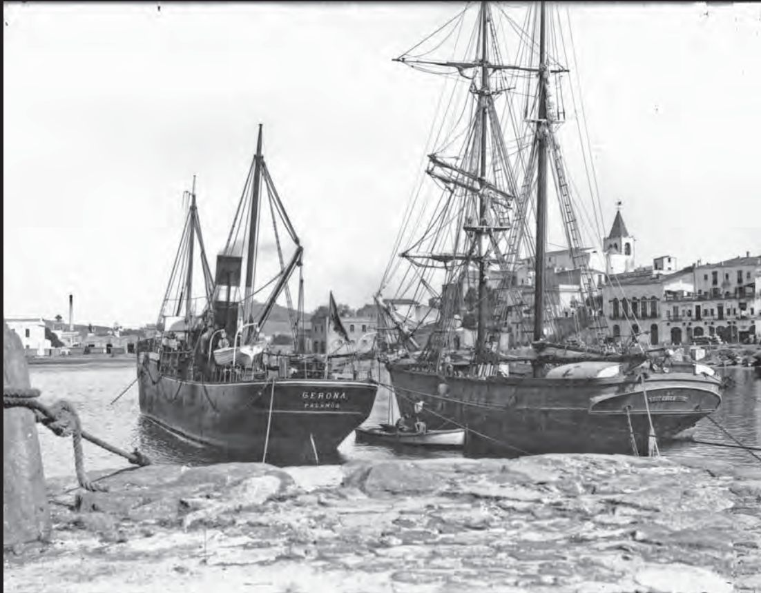
El moll vell de Palamós abans de les inundacions de la tardor de 1908. En primer terme, dos vaixells: el vapor Gerona i el Chile . Al fons, a l'esq