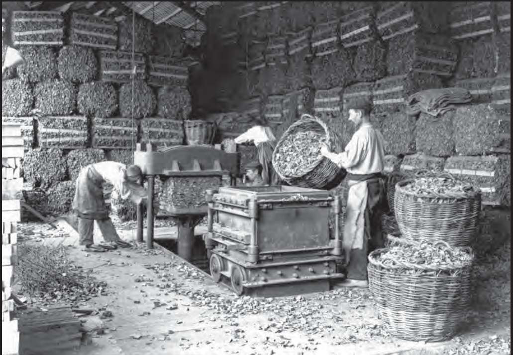
Treballadors a la sala de premsa dels residus de la fàbrica surera de Can Mario. Les sobres dels taps es premsaven per fer-ne aglomerat i comercialitzar-lo de nou. A la imatge, s'observen les piles de paquets premsats. (ca. 1910)