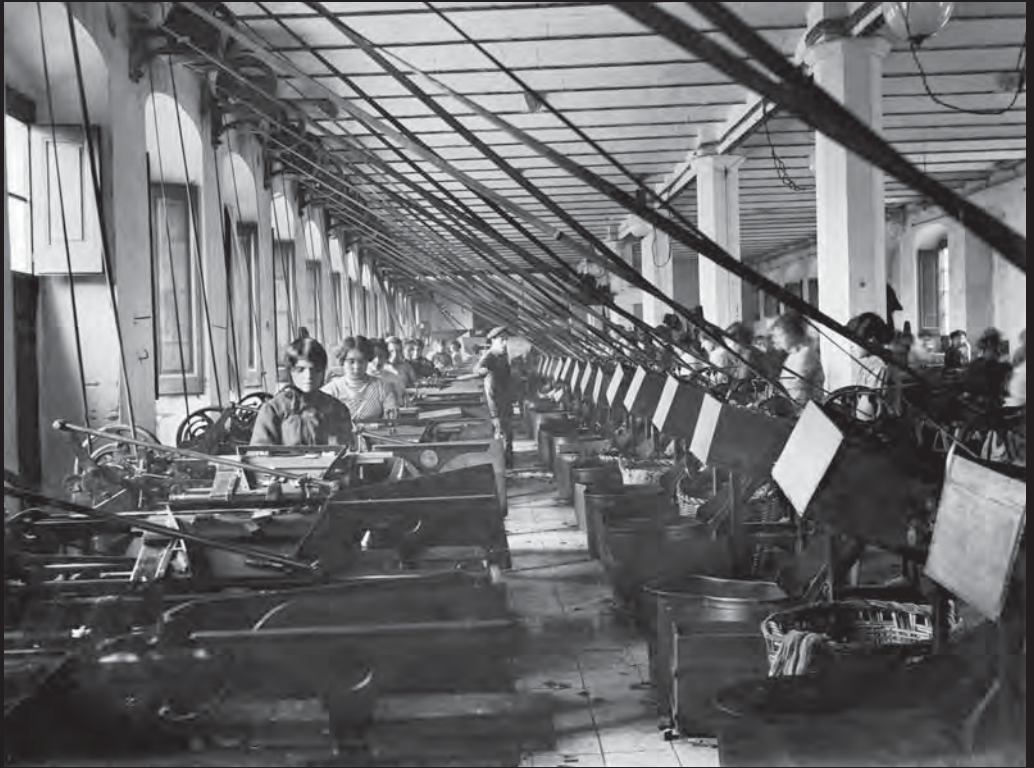
Dones treballant a la sala d'esmerilar de la fàbrica Forgas, dedicada a la indústria surera, a Begur, sota la presència de l'encarregat, al centre de la imatge.