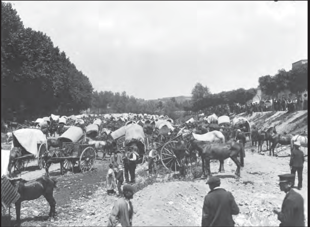
Concentració de tartanes, carros i cavalls a la llera del riu Daró, a la Bisbal d'Empordà. Probablement, un dia de fira o de mercat. (1900-1910)