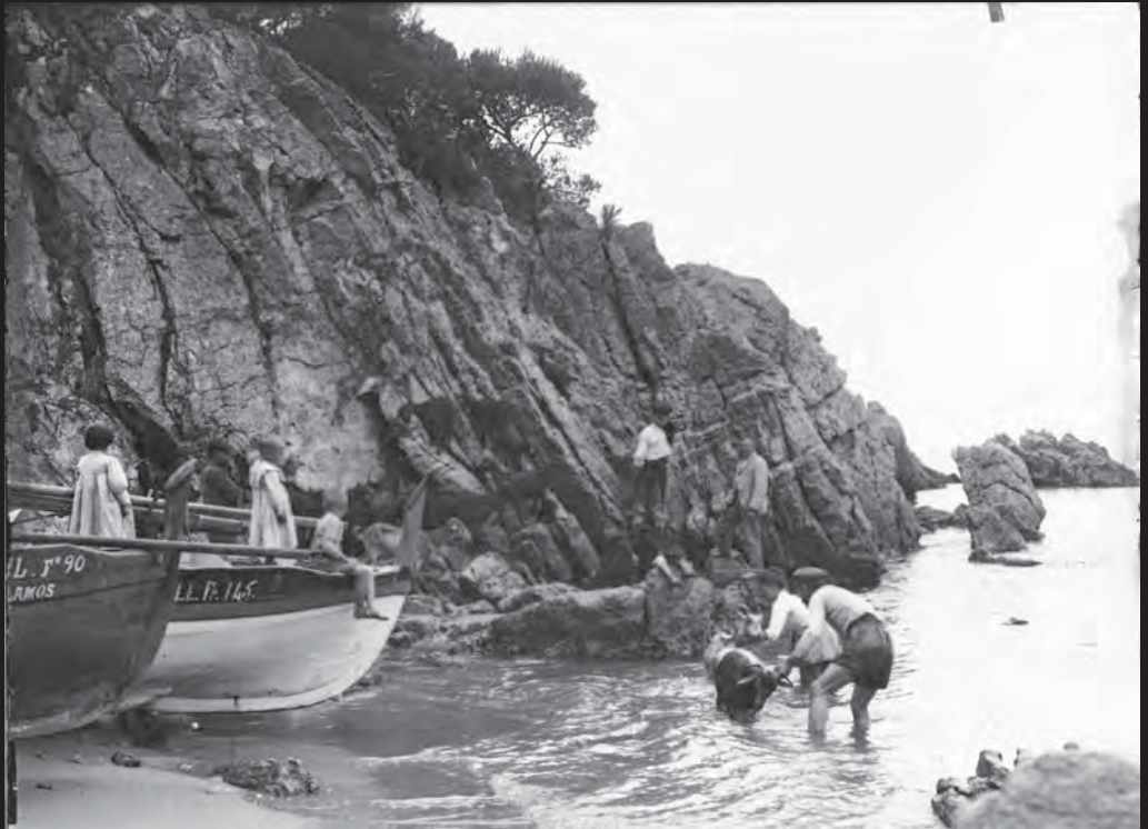
Homes i infants rentant unes cabres a la cala dels Canyers de Palamós.