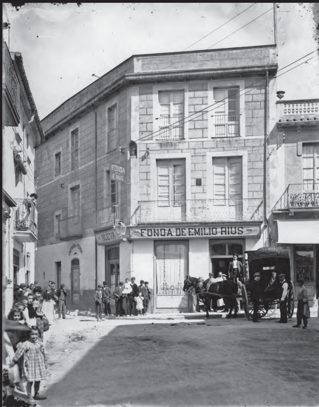
Façana de la Fonda de Emilio Rius, al carrer de Cavallers cantonada amb el carrer Estret de Palafrugell. A la porta de l'hostatgeria hi ha el carruatge per transportar els hostes des de l'estació del tren.