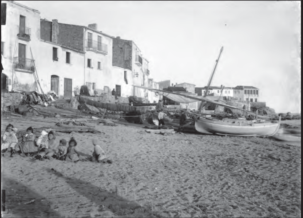
Infants asseguts a la sorra de la platja del Port Bo, a Calella de Palafrugell. Al fons, un homes al costat de llauts, alguns amb màstils de vela llatina, avarats a la platja. (ca. 1915)