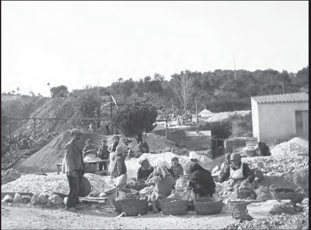
Dones triant mineral a la mina Maria de Mont-ras. (1917-1918)