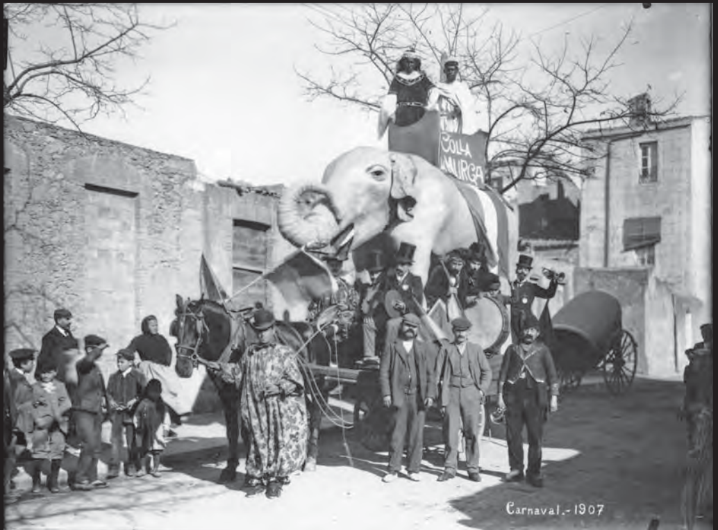
Carrossa de la colla La Murga, amb la figura d'un elefant asiàtic, torre i dos personatges caracteritzats com a orientals, durant la celebració del Carnaval de 1907 a Palafrugell.