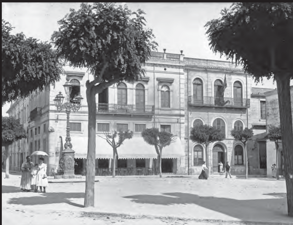
La Plaça Nova de Palafrugell. (1905-1908)