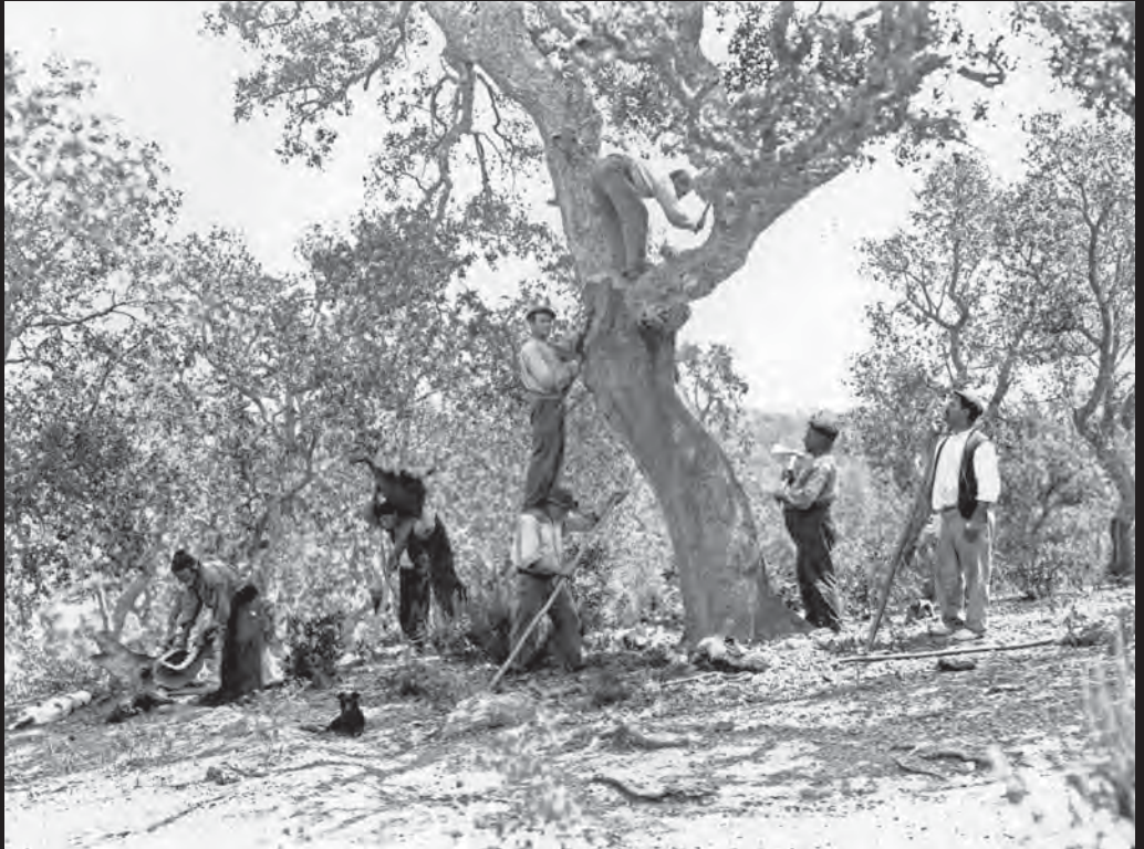
Pela del suro a Fitor, a principis del segle xx. Escenificació de la forma d'extreure el suro de les alzines sureres, amb l'ajut de la destal, per tallar, i del mànec i bastons llargs, per separar el suro de l'escorça. (ca.1910)