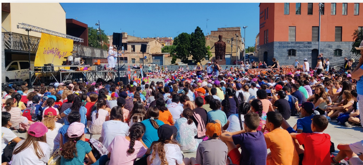
Cloenda Passaport Edunauta 2022-2023

La participació registrada va ser del 75% segons els les enquestes.