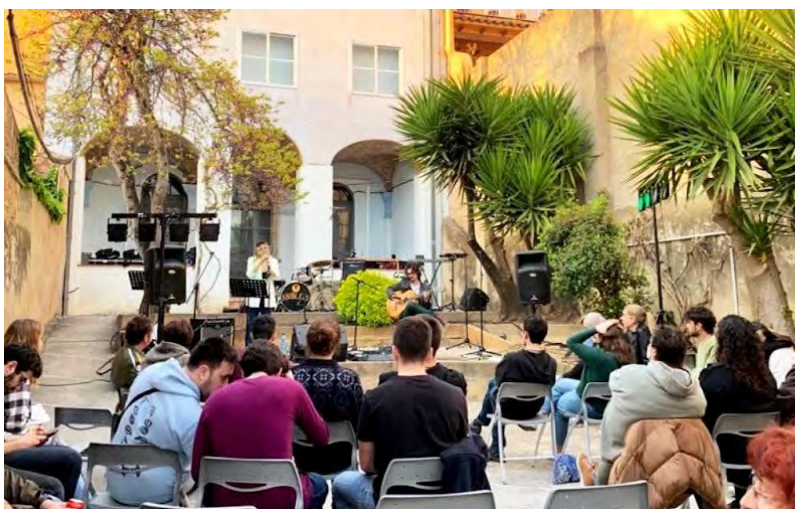
Concert al pati de Can Genís