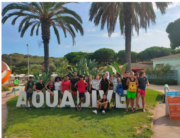
Participants de l'Espai Jove durant l'estiu