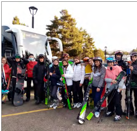
Esquiada a la Masella