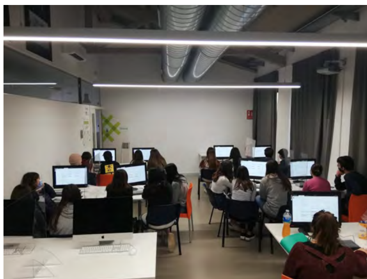
Aula oberta al Punt Òmia