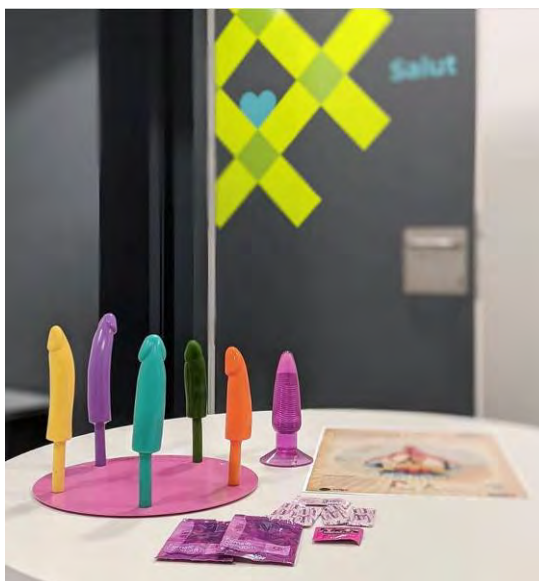
Assessoria de salut – gegants encantats