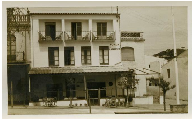
Hostal La Llagosta de Llafranc, 1962.