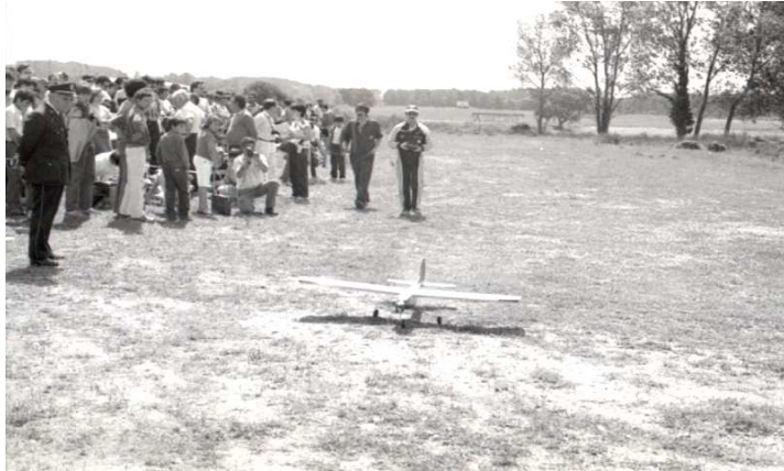
Exhibició d'aeromodelisme a l'autovia, 26 de maig de 1985.