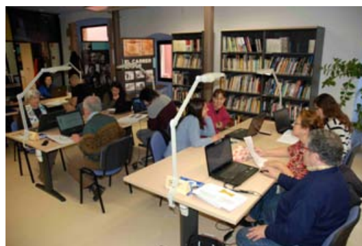
Viquimarató "Dones i Música" a l'AMP, 5 de març de 2016.