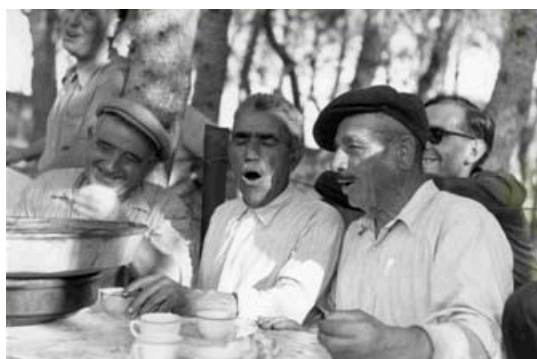
Imatge promocional del 50è aniversari de la Cantada d'Havaneres de Calella (IPEP).