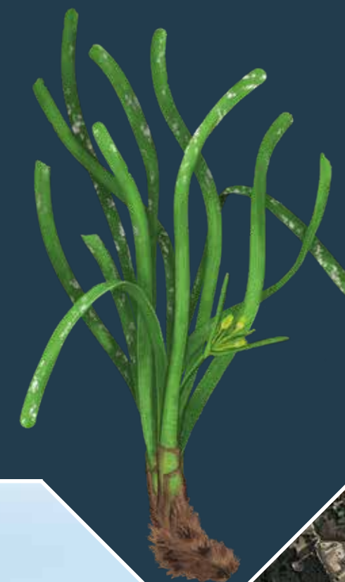
LA POSIDÒNIA ( Posidonia oceanica )

La posidònia ( Posidonia oceanica ) és una espècie amenaçada que està desapareixent progressivament. Les praderies estan sotmeses a fortes pressions degudes a l'activitat humana, i per això la seva extensió a la Mediterrània s'ha reduït des del 1960. Les principals amenaces són la contaminació marina, la urbanització del litoral, les males pràctiques de fondeig, la pesca amb males arts, les espècies invasores i el canvi climàtic.