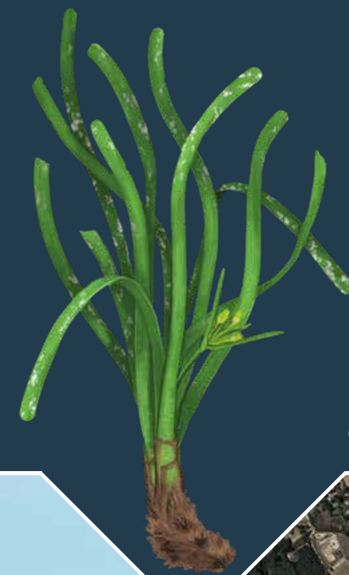
LA POSIDÒNIA ( Posidonia oceanica )

La posidònia ( Posidonia oceanica ) és de vital importància per al funcionament dels ecosistemes litorals mediterranis, per a la conservació de la biodiversitat, per a la mitigació dels efectes del canvi climàtic, per a la protecció de la sorra de les platges davant dels temporals marítims i per al manteniment d'activitats econòmiques locals com la pesca.