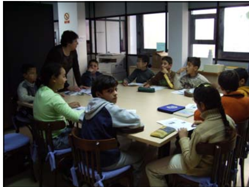
Taller de 5è i 6è de Primària del CEIP Torres Jonama

Un taller escolar, una classe de preparació del treball per al Premi Mestre Sagrera, una sortida cultural... Qualsevol motiu és bo per fer una visita a l'Arxiu i conèixer els seus fons i serveis.