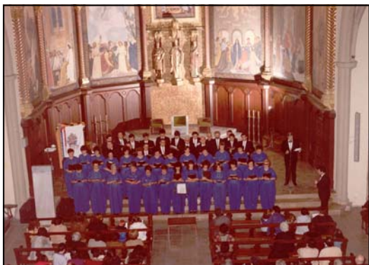
Nadal 1982 a l'església parroquial de St. Martí