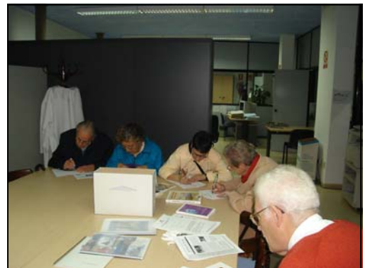
Socs del Club Sant Jordi