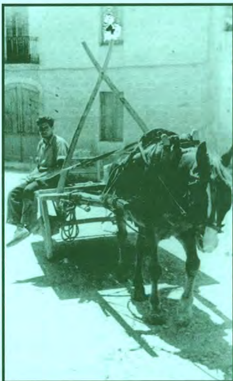
Carreter amb la carreta i el cavall. Aquest fou un de tants oficis que van créixer en el segle XIX a redós de la indústria del suro, i que anà desapareixent a partir del segle XX amb la motorització dels transports. El seu auge i el seu declivi es pot resseguir molt bé a través del recomptes de població

L'estudi dels recomptes de població i, sobretot, la comparació de les dades corresponents a diferents èpoques permeten de veure o, si més no, detectar la incidència dels esdeveniments i de les transformacions que expliquen l'evolució demogràfica, social, cultural i, en definitiva, històrica d'una societat. Aquests documents són de gran ajuda per a tota investigació històrica que pugui comptar amb ells, perquè, malgrat les seves limitacions, ofereixen a l'investigador una visió de