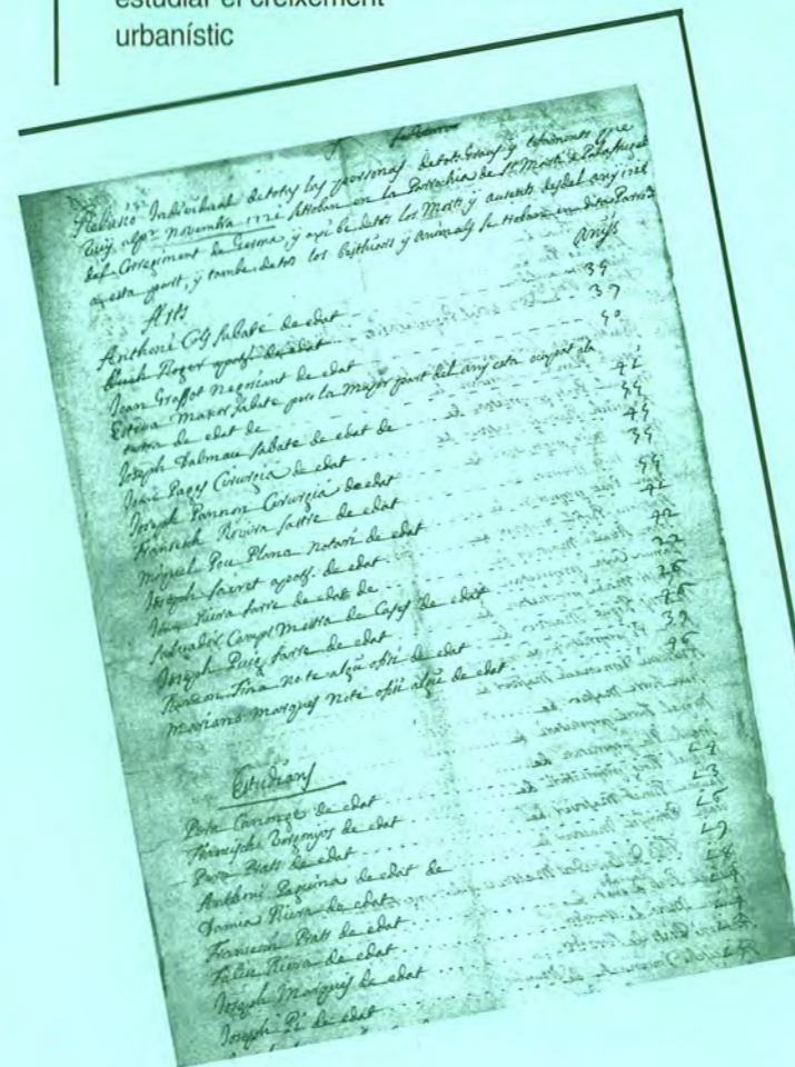
Relació Individual de todas las personas de tots graus i estaments que viu al pr. Novembre 1721 se troben en la Parrochia de St. Martí de Palafrugell (...).

La fiabilitat dels recomptes de població depèn de diversos factors: de la pròpia finalitat del recompte (els que són de caràcter fiscal són més propensos a contenir errors i omissions que els que tenen una finalitat merament estadística); dels mitjans disponibles per a dur-los a terme (els d'ara són indubtablement més fidedignes que els dels segles precedents); i, en darrer terme, de l'eficàcia dels funcionaris encarregats d'efectuar-los, així com de la voluntat de la gent a l'hora de cooperar. En el cas concret dels padrons, un dels problemes que plantegen és el retard amb què sovint s'enregistren els canvis haguts (el mateix problema passa amb els registres parroquials). Per exemple, els canvis de residència, quan aquests són temporals, molts individus no els registren al padró.