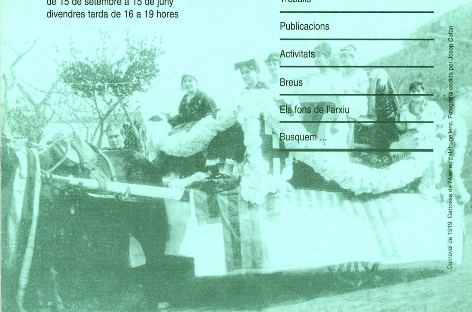
Carnaval de 1919. Carrossa de l'Ateneu palafrugellenc.