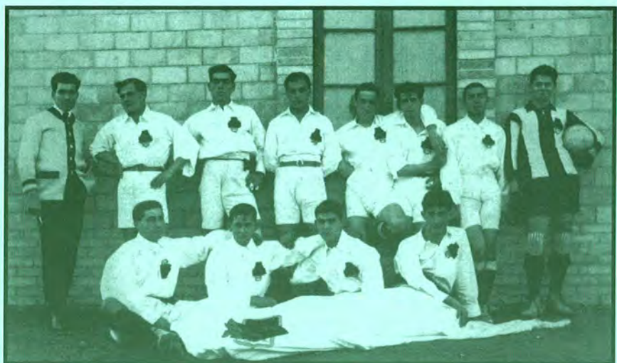
Equip de futbol de l'Ateneu Palafrugellenc, campió gironí l'any 1917. Fotografia publicada a la revista Catalunya Sportiva el 21 de març de 1917.

Estudiant d'Educació Social, Universitat de Girona