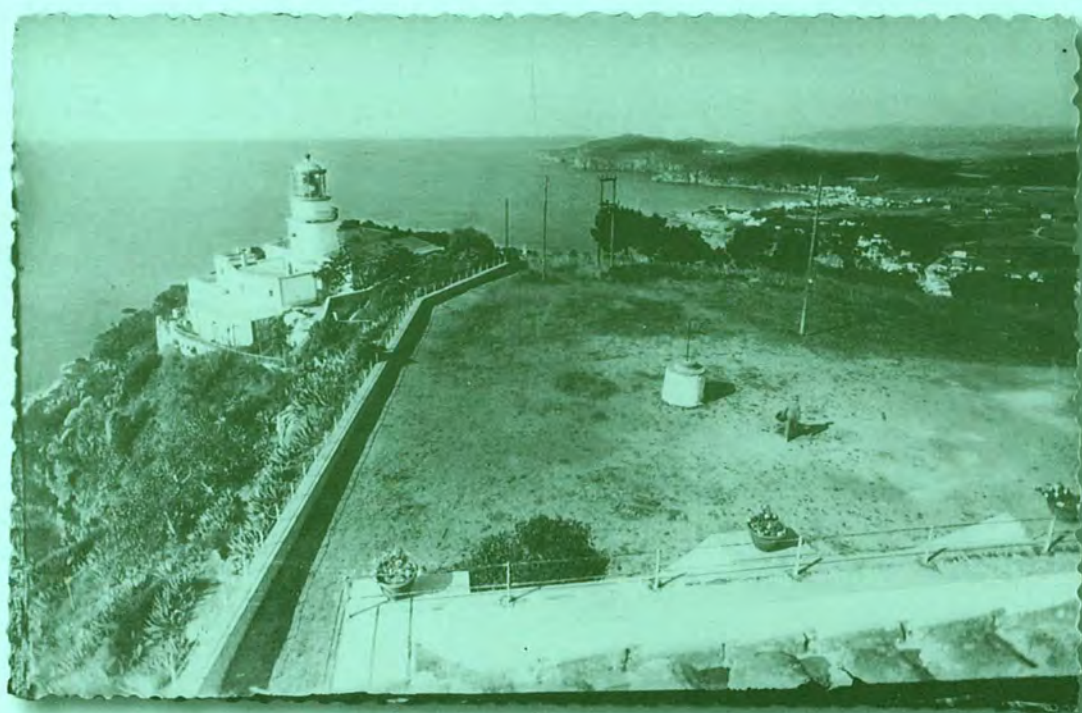
El far de Sant Sebastià vist per Puignau