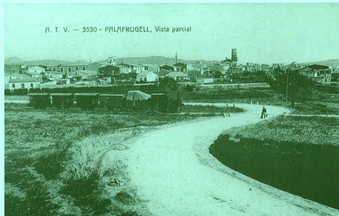
Palafrugell a principis de segle. En primer terme, el tren petit.

41 Llibres d'actes (de seguretat i de consulta), 5 fons patrimonials, 2 fons personals, 1 del Llibre de Privilegis dels segles XVI-XVII (original conservat a la Biblioteca de Catalunya), exemplars del diari Ara (publicació d'ERC editada a Palafrugell en els anys trenta)