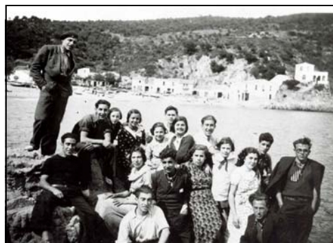
Una sortida de membres de l'Ateneu a Tamariu el 4 de maig de 1934.

L'aposta de l'Arxiu Municipal de Palafrugell per un butlletí digital es confirma com una opció a continuar. De les subscripcions rebudes, 141 sol·liciten l'enviament per correu electrònic i 55 per correu postal. I pel que fa a les consultes del butlletí, les estadístiques del web de l'Ajuntament ens indiquen que el Butlletí de l'arxiu de l'estiu ha rebut 418 visites.