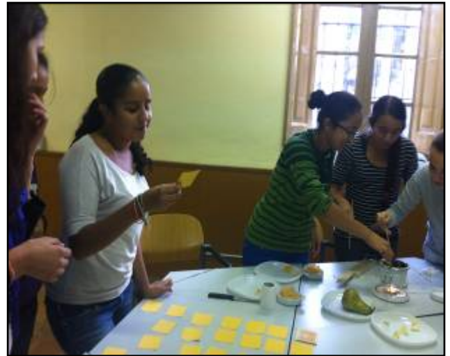
Punt Jove de Salut: taller Som el que Mengem, Dia Mundial de l'Alimentació