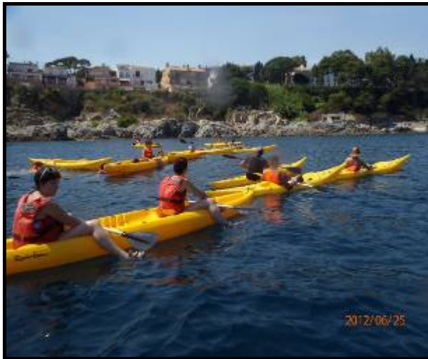
13Progrés: sortida amb caiac