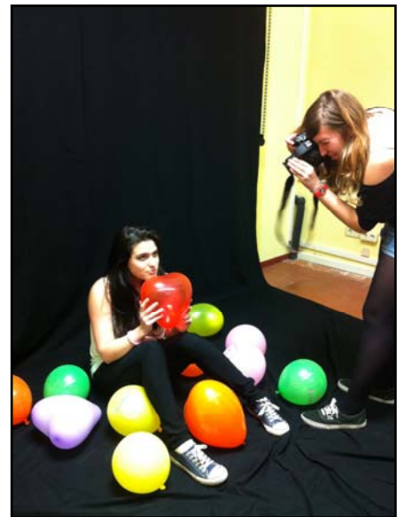
Punt Òmnia: taller de fotografia