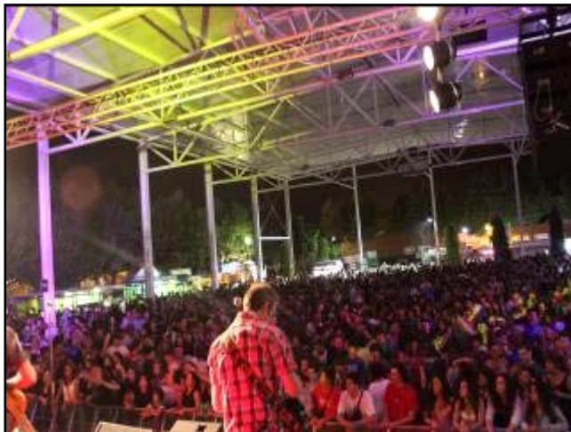
Festa a la Nit: concert a barraques