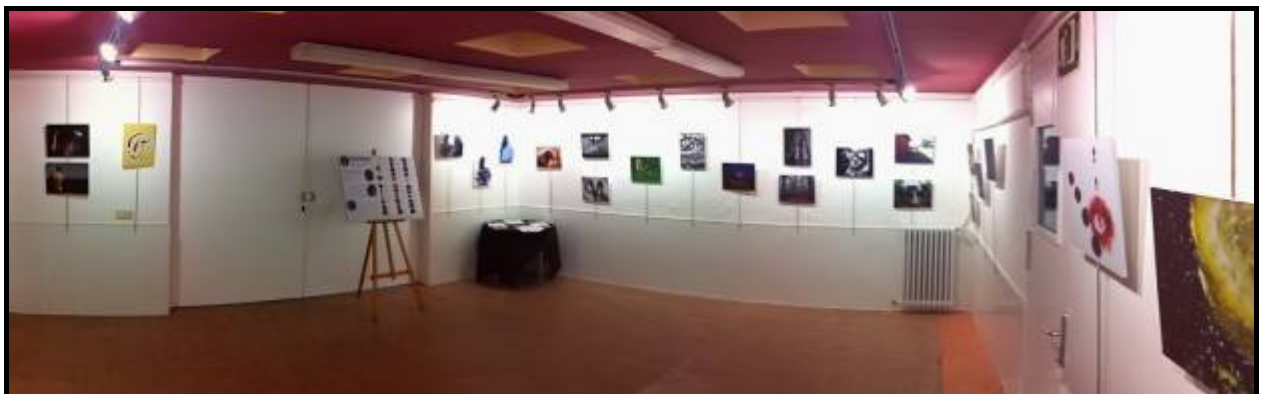
Tabarín: exposició de l'Associació Fotogràfica Desenfocats