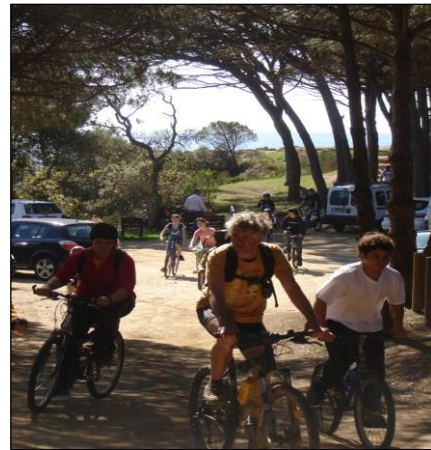
Sortida en BTT Setmanes Jovrd