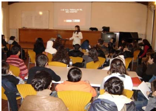
Can Genís Jornades de Portes Obertes