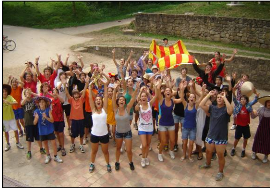
Colònies Puigpardines Estiu Jove