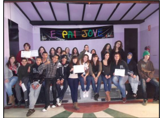
Els Ametllers Curs premonitors/es Espai Jove