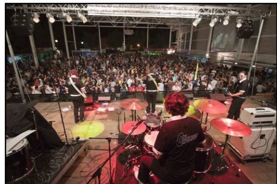
Pista exterior del Pavelló Poliesportiu Festa a la Nit - barraques